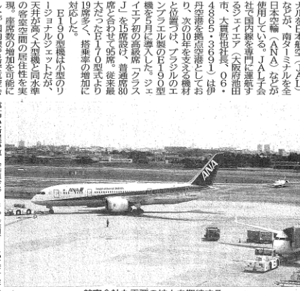
航空会社も需要の拡大を期待する

大阪国際空港(伊丹空 港)のターミナルは、地 域の利便性を向上させ るため、改修工事が進 んでいる。改修工事は、 地域の利便性を向上せ るためである。大阪国 際空港(伊丹空港)の ターミナルは、地域の 利便性を向上させるた めに、改修工事が進ん でいる。改修工事は、 地域の利便性を向上せ るためである。